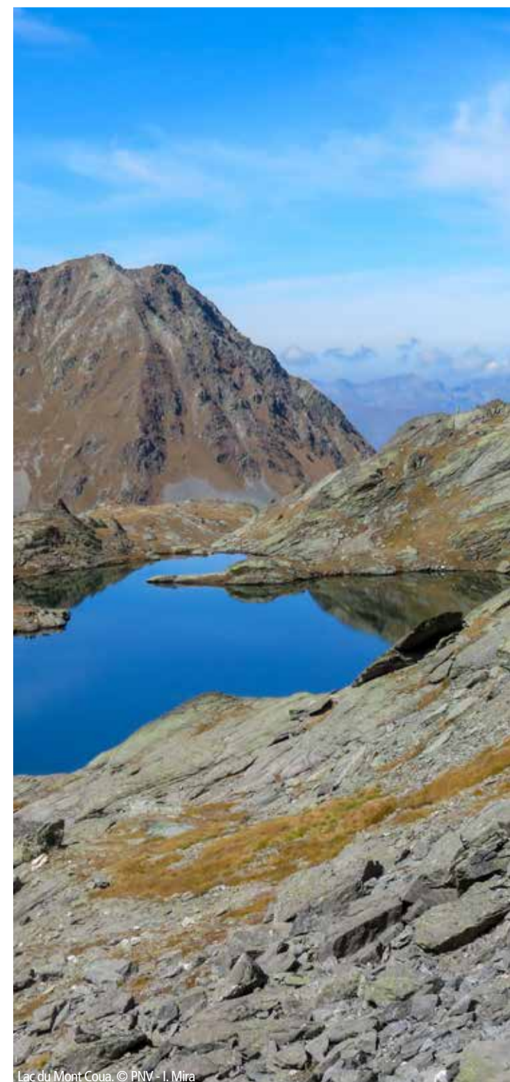
Lac du Mont-Coua.